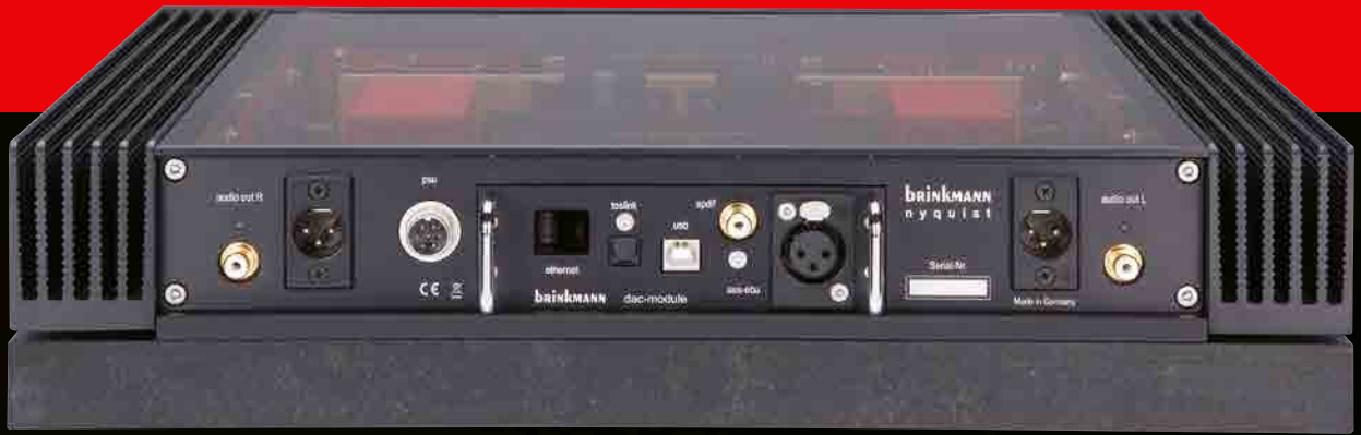
▲ Die Rückseitenansicht des Nyquist mit den Bit-Inputs am Digitalmodul und außen platzierten Analogausgängen